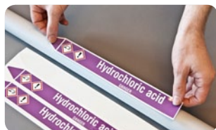
S podkladovým papírem

Náš samolepicí laminovaný polyester s nízkým obsahem chlóru je odolný vůči chemikáliím, ultrafialovému záření a extrémním povětrnostním podmínkám. Akrylové lepidlo má velmi nízký obsah halogenu, díky čemuž je vhodný k použití i v jaderném průmyslu.