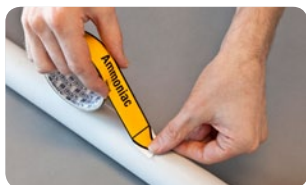
Bez podkladového papíru